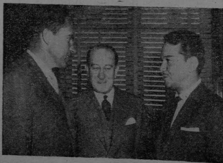
Mario Moreno "Cantinflas" a la derecha, con el embajador de México en Estados Unidos, Manuel Tello, en el centro y el vicepresidente norteamericano, Richard M. Nixon, durante la fiesta ofrecida en Washington en honor del popular cómico mexicano y durante la cual "Cantinflas" demostró ser un excelente embajador de buena voluntad.