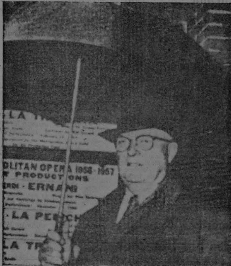
Milton Cross, popular anunciador y comentarista de la transmisión por radio de las obras de ópera desde el Metropolitan Opera House, de la ciudad de Nueva York.

En la historia de la radio de los países de la América, un programa destaca por su antigüedad y el número de sus oyentes. Se trata de la transmisión que desde la Metropolitan Opera House, de Nueva York, se viene realizando desde la cadena de estaciones de la ABC y que sin interrupción ha mantenido el prestigio de las audiciones por radio de música teatral en veinticinco temporadas con un público oyente que se calcula en más de diez millones de personas.